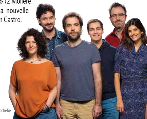
Ce programme et les distributions vous sont présentés sous réserve de modifications indépendantes de notre volonté.