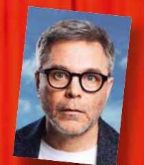
Guillaume DE TONQUÉDEC